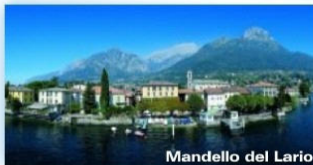
Mandello del Lario